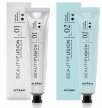
BOOSTER 01 ve 02