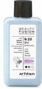
● FULL Kalıcı Boyama