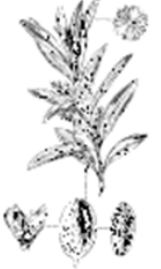
Organic Olive Oil Illuminating, Emollient Restructuring