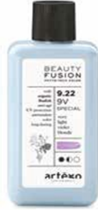
◐ DEMI PLUS Yarı Kalıcı Boyama