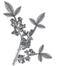
Organic Zanthalene* Softening Soothing, Relaxing