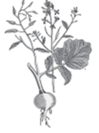
Organic Radish Anti-Age, Hydrating, UV rays and pollution shield