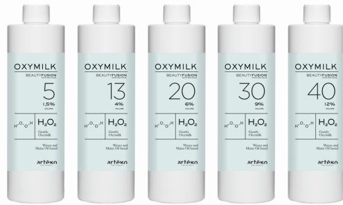
OXYMILK 5, 13, 20, 40 VOL. (OKSİDAN)