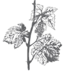
Organic Vitis Vinifera Antioxidant, Nourishing Strengthening