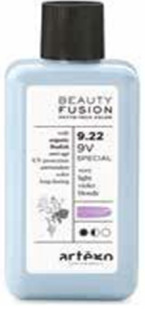
○ GLOSS Ton Üstüne Ton Boyama